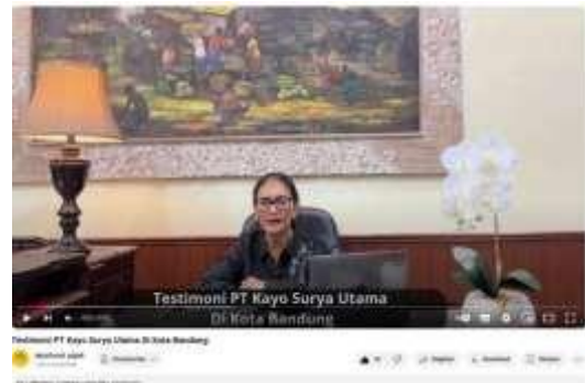
Testimoni PT Kayo Surya Utama